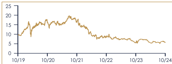
ANDAMENTO AZIONE NEXI S.P.A.: ULTIMI 5 ANNI*