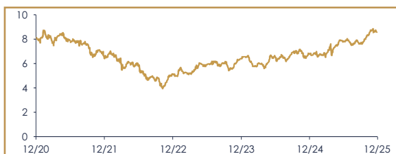
ANDAMENTO AZIONE ENEL SPA: ULTIMI 5 ANNI*